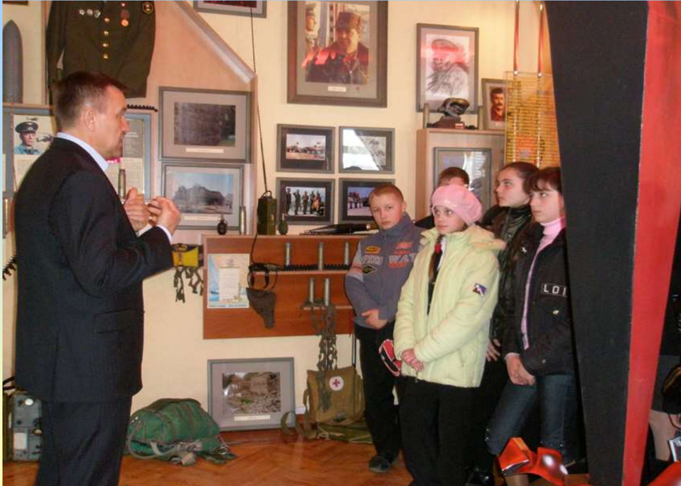
У Харківському музеї - діорамі воїнів-інтернаціоналістів