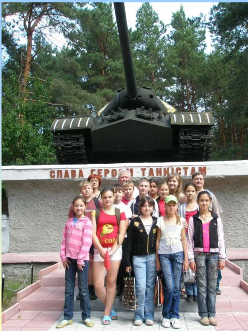
Експурсія до військової частини А-0501 с.Клугино-Башкирівки