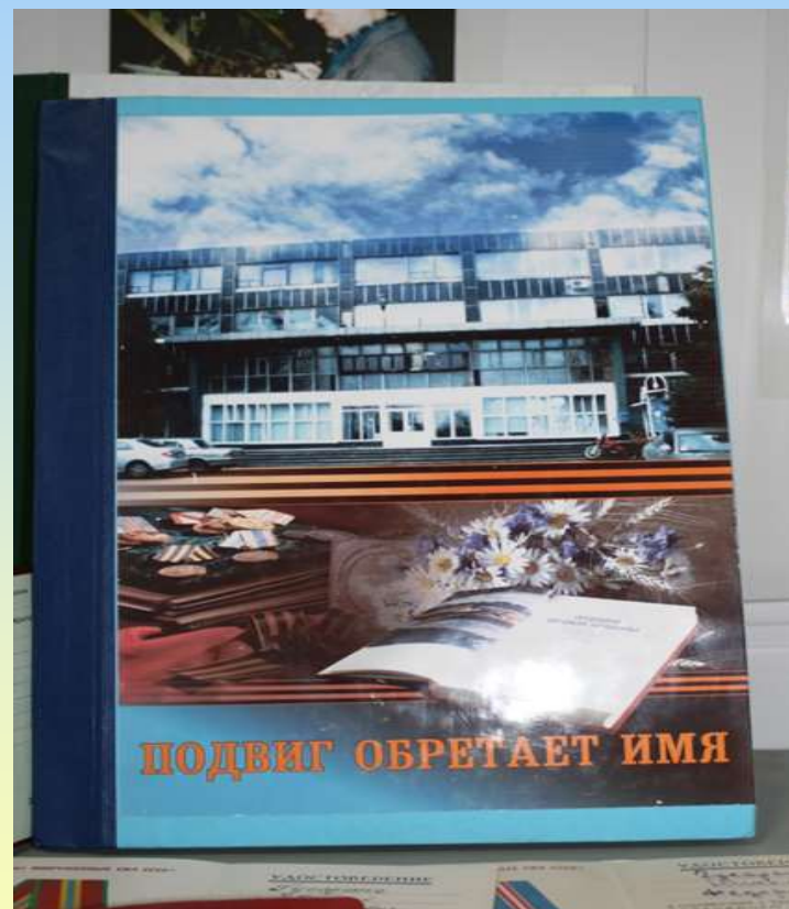
Книга «Подвиг обретает имя»