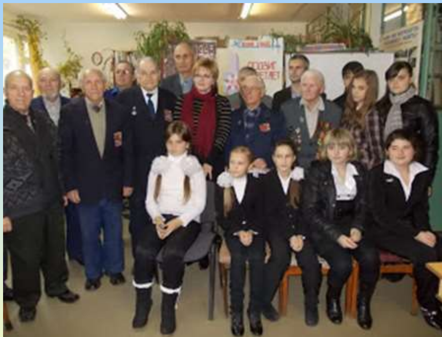
Захід «Чорна трагедія на випаленій землі»