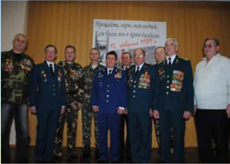
Уроки мужності, проведені афганцями