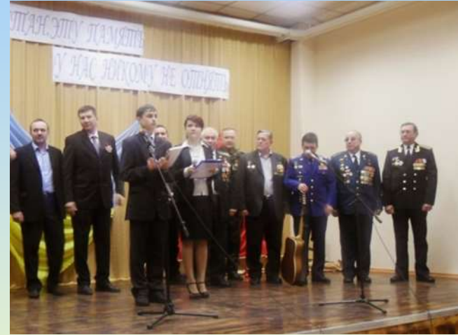
Свято «Афганістан – цю пам'ять нам ніколи не забрати»