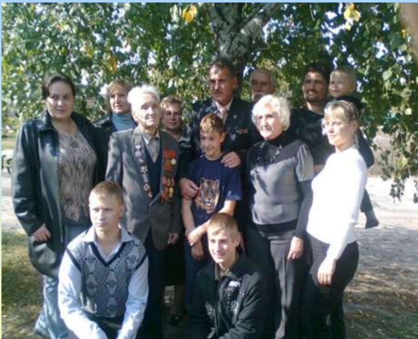
Допомога ветеранам війни